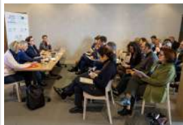
Assemblée Générale de l'USH BFC