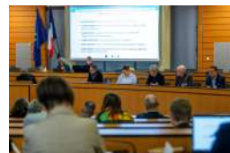
Réseau régional des acteurs de l'habitat BFC