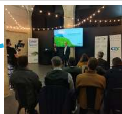
Journée Gaz vert avec GRDF