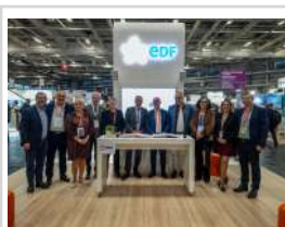
Signature de la convention avec EDF au Congrès Hlm