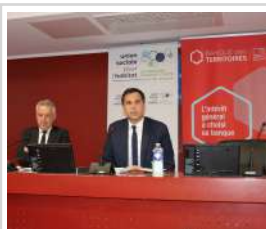
Rencontre annuelle avec la Banque des Territoires BFC