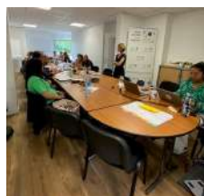
Atelier Politiques Sociales 1er quartile