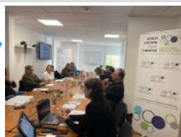
Atelier Impayés et prévention des expulsions