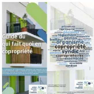
Guide du “qui fait quoi” en copropriété , destiné aux équipes des organismes de BFC.

Ces travaux ont abouti à la création de deux supports pédagogiques sur les responsabilités des organismes en matière de copropriété :