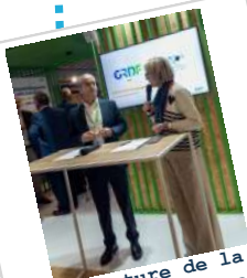
Signature de la convention avec GRDF au Congrès Hlm