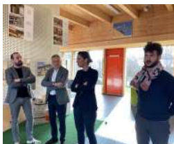
Visite de la Maison des Energies à Héricourt