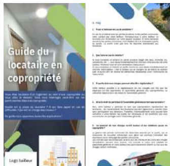
Guide du locataire en copropriété , conçu pour les locataires occupant un logement social situé dans une copropriété.