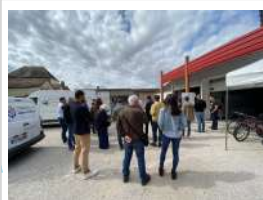
Rencontre bailleurs et acteurs du réemploi