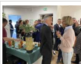
Inauguration des nouveaux locaux de l'USH BFC et d'AREHA Est