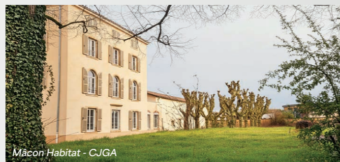
Mâcon Habitat - CJGA

Ils sont également engagés dans la revitalisation et la redynamisation des centres anciens, en milieu rural comme en milieu urbain, en cohérence avec les politiques portées par les territoires (habitat, déplacement, emploi, cohésion sociale...) via les Plans Départementaux de l'Habitat, les Programmes Locaux de l'Habitat, les Contrats de Ville, les dispositifs Action Cœur de Ville, Petites Villes de demain, etc.