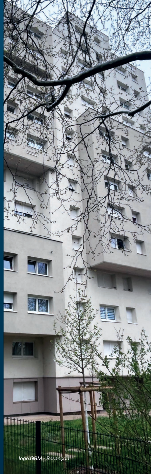
loge.GBM - Besançon

L'USH BFC porte à la connaissance du niveau national les situations et enjeux régionaux et elle contribue à l'évolution des politiques nationales à partir des réflexions et des pratiques locales et régionales.