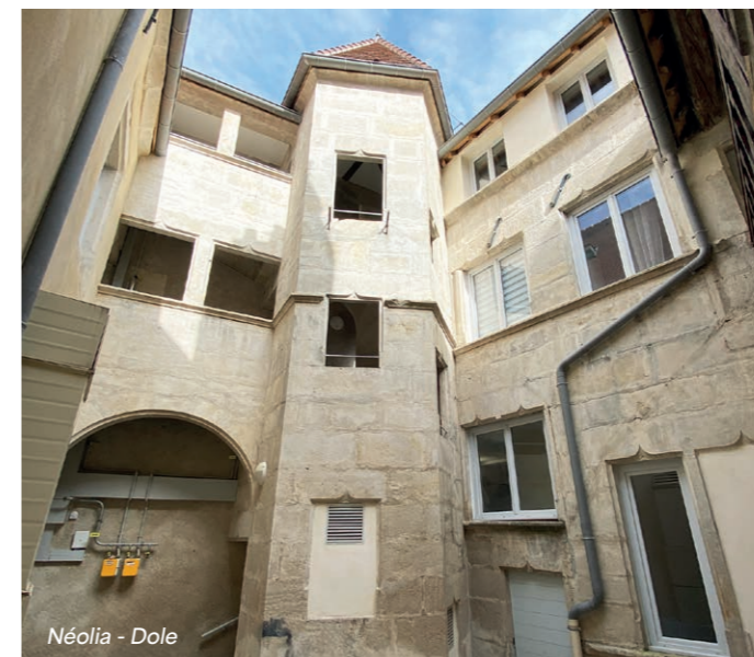
Néolia - Dole

Incubateurs d'idées nouvelles , ils sont tournés vers l'innovation technologique et numérique pour rendre plus performantes encore les rénovations et les constructions, et pour proposer de nouveaux services en ligne aux locataires.