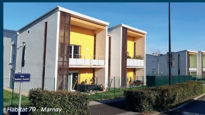
Habitat 70 - Marnay

Association (loi 1901), l'Union Sociale pour l'Habitat de Bourgogne-Franche-Comté est la représentation régionale du Mouvement HLM. Elle réunit, fédère, anime et accompagne les 30 organismes de logement social de la région dans la réalisation de leurs missions d'intérêt général et dans la mise en œuvre des politiques nationales du logement.